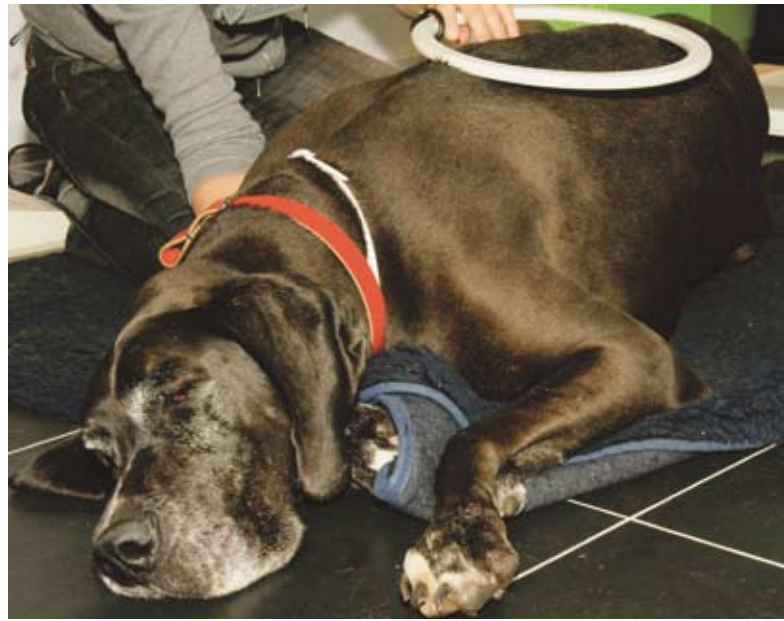
Een uitgevloerde Zora tijdens de magneetveldbehandeling.

Een dierfysiotherapeutisch onderzoek van haar rug levert geen duidelijke verschillen met andere keren op. Wel is heel duidelijk de maagzone, huidintrekking in het projectiegebied van de maag, aanwezig.